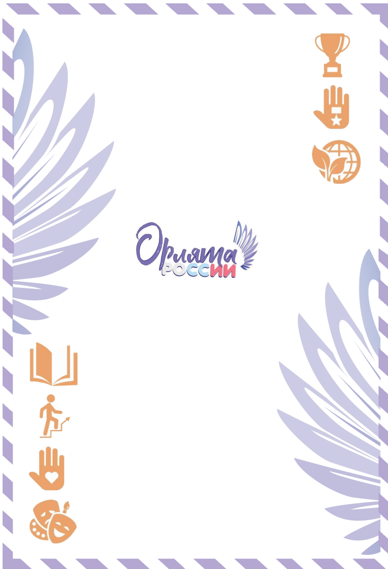
Рис. 2. Обратная сторона «Письма в Будущее»