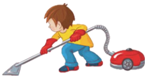
Наводить порядок дома: