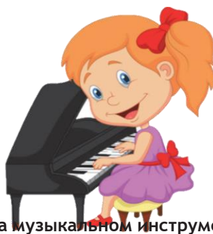
Играть на музыкальном инструменте: