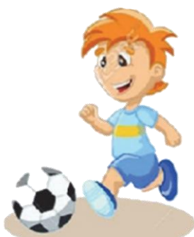
Играть в футбол: