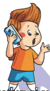
Разговаривать по телефону: