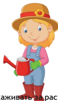
Ухаживать за растениями: