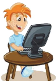
Играть в компьютерные игры: