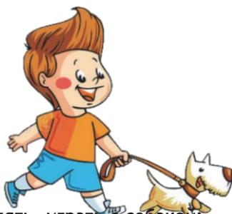
Гулять, играть с собакой: